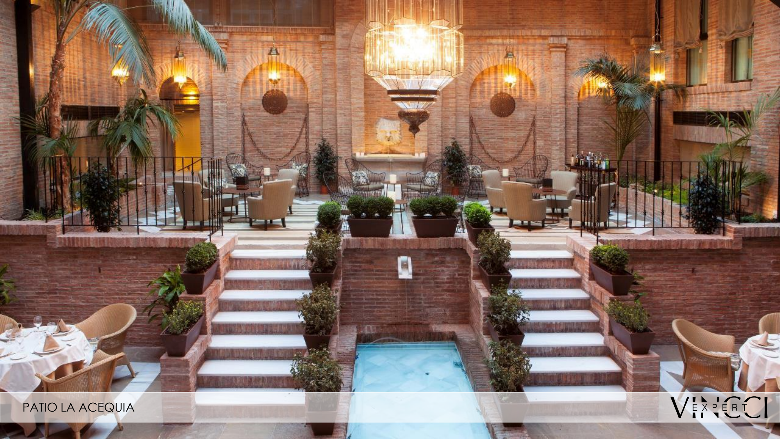
PATIO LA ACEQUIA